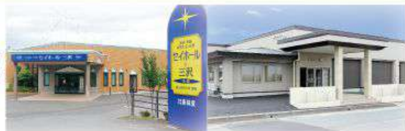
【セイホール★三沢】 三沢市松原町2丁目31-217 TEL.0176-51-2011