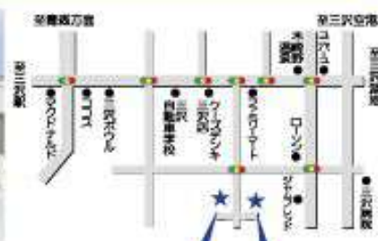
セイホール★絆 セイホール★三沢

まずは一度お気軽にご相談下さい。どんなことでもご相談承ります。 面接は随時行わせていただきます。(面接前に体験、見学、大歓迎です)