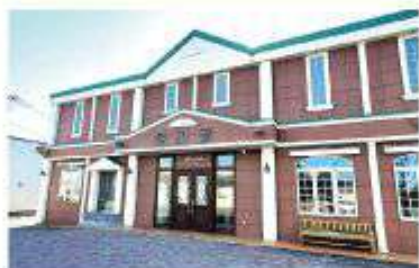
【株式会社 萬誠堂本社】 三沢市中央町3丁目2-22 TEL.0176-53-2787